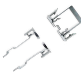
KIT COMPENSATORI BORDELESS VETRO