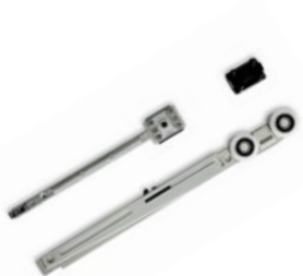
KIT LIGHT TOUCH BORDERLESS