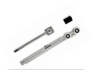
KIT LIGHT TOUCH BORDERLESS