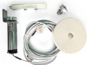
KIT CHIUDI NORMA