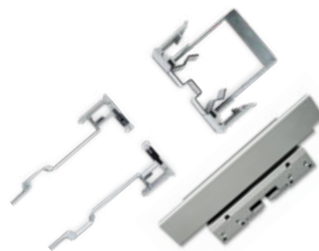
KIT VETRO BORDERLESS