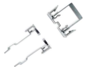
KIT COMPENSATORI BORDELESS VETRO