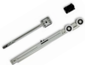
KIT LIGHT TOUCH BORDERLESS