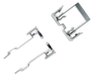
KIT COMPENSATORI BORDELESS VETRO