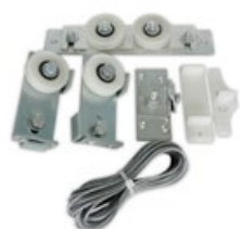
KIT TRASCINAMENTO PROGRESSIVO