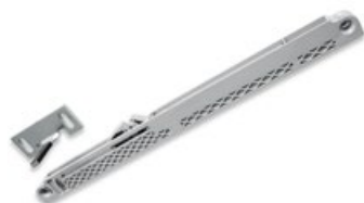
KIT LIGHT TOUCH