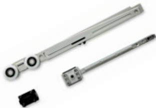
KIT LIGHT TOUCH VETRO