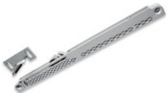
KIT LIGHT TOUCH