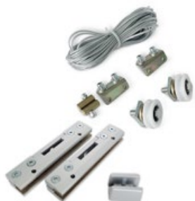
KIT APERTURA SIMULTANEA CRISTALLI