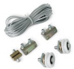
KIT APERTURA SIMULTANEA